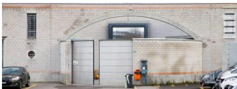
Prison de La Tuilière Chemin des Peupliers 4 1027 Lonay - Suisse

Il vous est possible de consulter ces bases légales ainsi que les directives qui s'appliquent à vous à la bibliothèque. En tout temps, ces directives font foi.